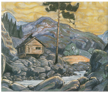
Décor de Peer Gynt