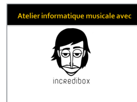
Fiche powerpoint proposée pour TNI

Combien j'entends d'ostinati différents, lesquels, ...?