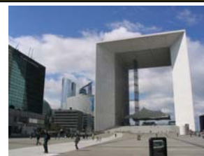
La Grande Arche de la Défense (1988)