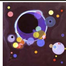
Several Circles (Kandinsky, 1926)