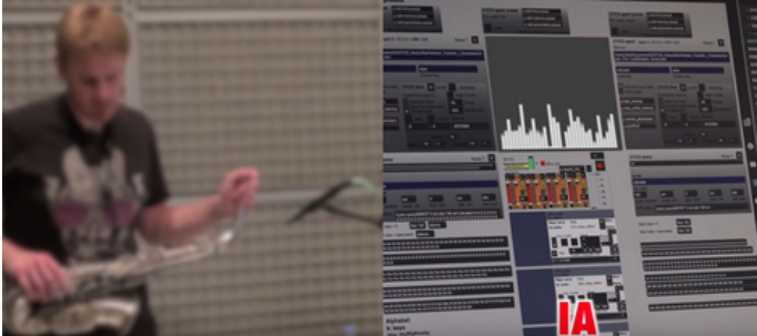
L'esprit sorcier - IA

- l'Homme est à l'initiative de la création- l'IA reformule à travers de l'ingurgitation massive de données