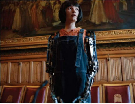
Dialogue avec des lords britanniques et le robot Ai-Da

Quels sont les points principaux de la discussion entre les lords britanniques et Ai-Da ?