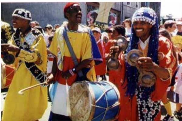
Procession Gnawa à Marrakech (instruments : les crotales et le tbel)

Cette confrérie fût créée au XVIème siècle par Sidi Mohammed Ben Aissa. Cette confrérie se rattache au soufisme. L'une de ses pratiques collective est la hadra. Cette danse se compose de 3 parties, dont la transe constitue le moment le plus fort de la soirée.