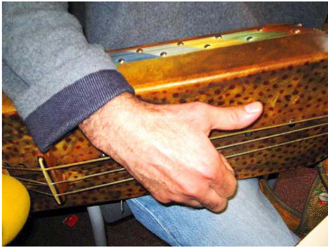
Détail de guembri (instrument à 3 cordes)