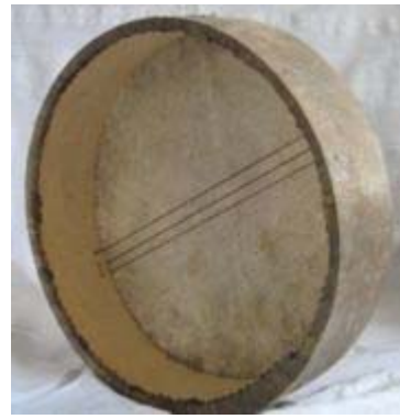
Bendir (tambour sur cadre)