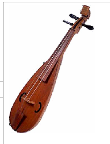
Rabab (violon marocain)