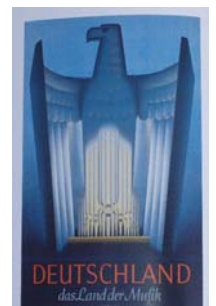
Poster pour l'exposition parisienne de 1937.