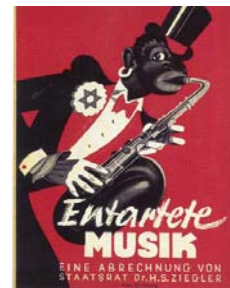
Brochure de l'exposition Musique dégénérée , Hans Severus Ziegler, 1938.