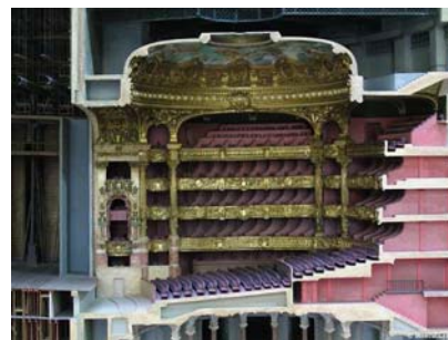
Maquette de l'opéra Garnier.

Le 1er opéra fut créé en Italie en 1607 : Orfeo de Monteverdi.