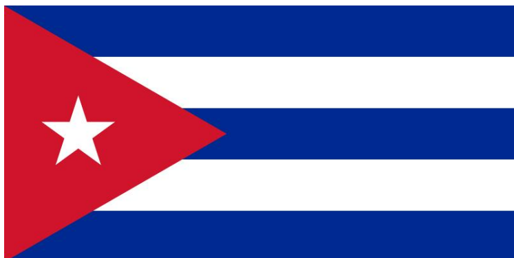
Drapeau de Cuba