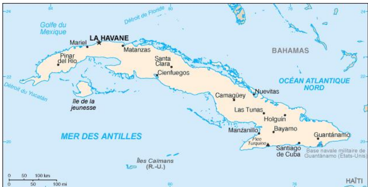
Carte de Cuba

Exemple à la guitare : Les accords sont Gm7, C79, F7 majeur et les mesures sont en 2/4