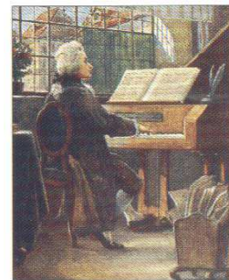
Mozart jouant du piano-forte

Cet instrument s'appelle ainsi car, à la différence du clavecin, il peut faire des nuances et en italien, piano-forte veut dire littéralement