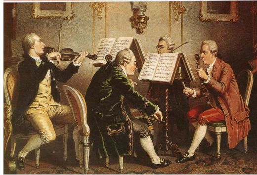
Quatuor à cordes comprenant 2 violons 1 alto et 1 violoncelle.

Généralités : L'époque classique est courte. Elle ne dure qu'un demi siècle : la 2ème partie du XVIIIème siècle . Sur le plan historique, en France, c'est d'abord la fin du règne de Louis XV auquel succède le roi Louis XVI puis la révolution .