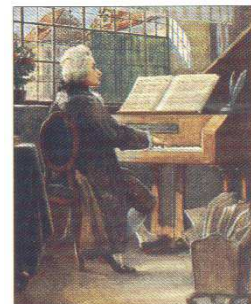
Mozart jouant du piano-forte

Cet instrument s'appelle ainsi car, à la différence du clavecin, il peut faire des nuances et en italien, piano-forte veut dire littéralement doucement-fort .