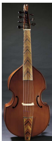
Une viole de gambe

= > Différences entre un violoncelle et une viole de gambe