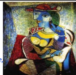
Portrait de Marie-Thérèse Pablo Picasso. 1937