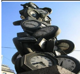
L'heure de Tous Arman.1985